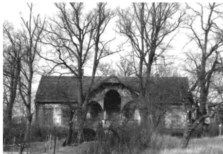
Dom č. 538 v Ružovej doline, bývalá Wolnerova vila.