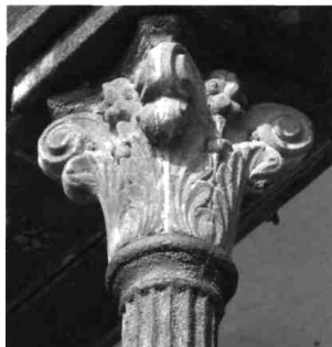
Dom č. 545, hlavica liatinového stĺpika