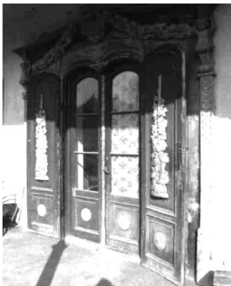
Dom č 545, bývalá krčma v Ružovej doline, výzdoba vstupných dverí.

V čom je jedinečnosť týchto pomaly zanikajúcich historických lokalít? Zatiaľ čo vyššie uvádzané rekreačné osady a prímestské víkendové strediská (bratislavská Železná studnička, Harmónia pri Modre, Čermel' pri Košiciach) vyrástli v lesnom prostredí a slúžili výlučne na oddych a zábavu bohatších vrstiev meštianstva